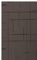
U 741 Lava