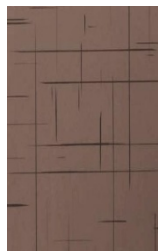
U 1191 Graubraun