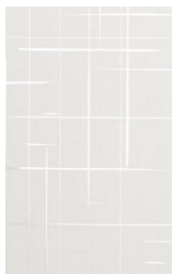
U 1027 Icy White

We would be pleased to inform you about our Flash design the dimensions and substrates .