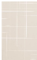
U 1379 Magnolie